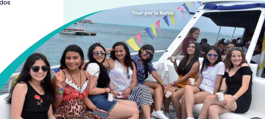
Tour por la Bahía