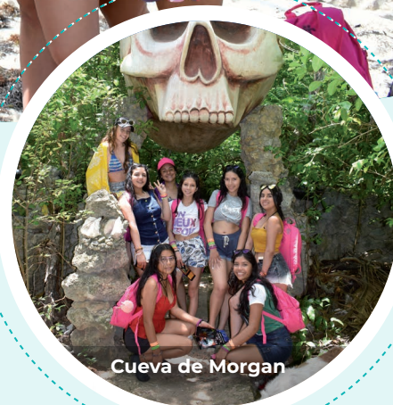
Cuevā de Morgan